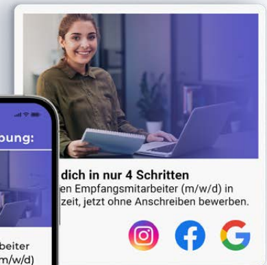
Landingpage mit Quick-Bewerbung, Display Ads auf Social Media / Google