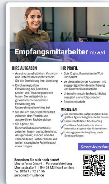
Stellenanzeige mit QR-Code

/ Mit innovativen Tools Jobsuchende erreichen